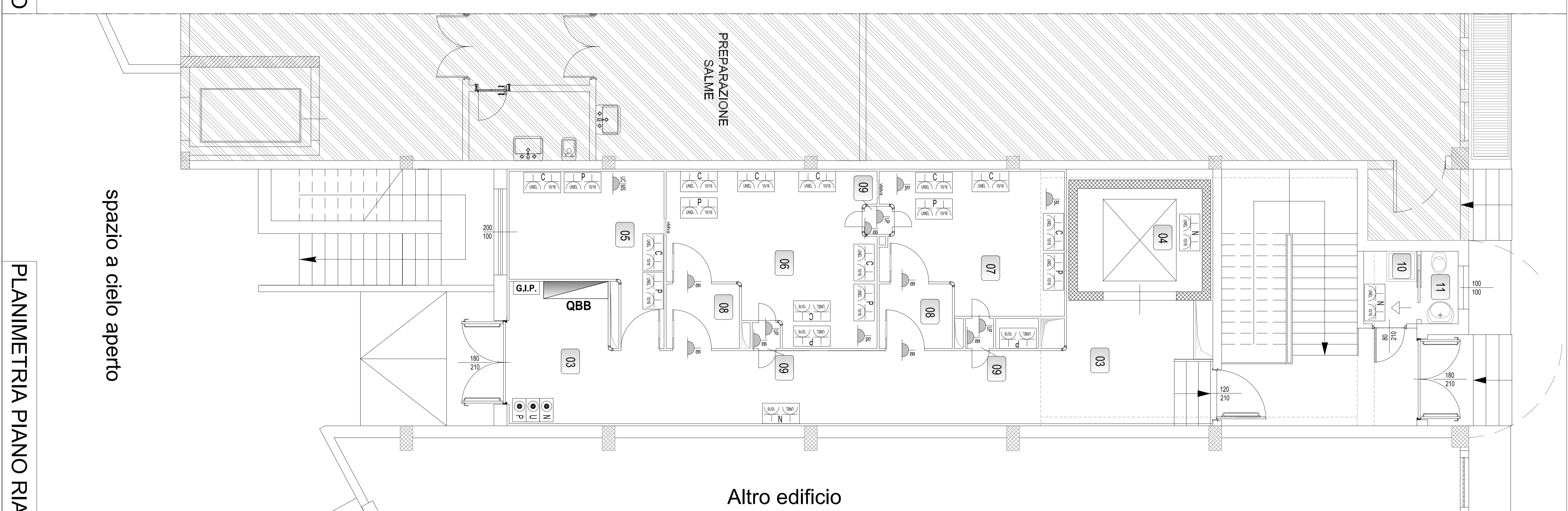
PLANIMETRIA PIANO RIALZATO